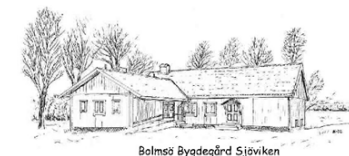
Bolmsö Bygdegård Sjöviken